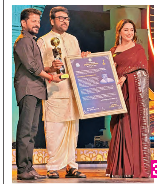
గురువారం చిరంజీవికి ఆవాడు అందజేస్తున్న సీఎం రేవంత్

22 నుంచి రైతు భరోసా వేస్తాం.. రైతును రాజు చేయడమే లక్ష్యం రవీంద్రభారతిలో శ్రీపరాభవ నామ ఉగాది వేడుకల్లో సీఎం రేవంత్ హాజరైన డిప్యూటీ సీఎం భట్టి విక్రమార్కు, మంత్రులు