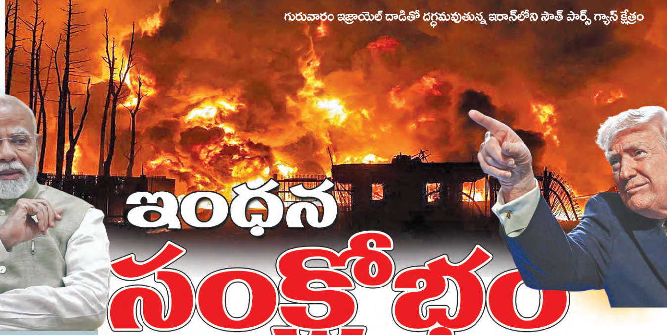
గురువారం ఇజ్రాయల్ దాడితో దగ్ధమవుతున్న ఇరాన్ లోని సౌత్ పార్స్ గ్యాస్ క్షేత్రం

దాడులు ఆపాలి ఇరాన్ కు 12 దేశాల అర్జీమేటం లయాన్ లో అరబ్, ఇస్రామిక్ దేశాల విదేశాంగ మంత్రుల భేటీ