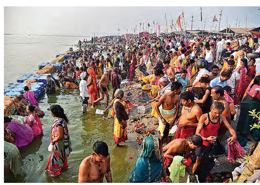
ప్రయాగ్ రాజ్ గురువారం సవరాత్రి పండుగ మొదటి రోజున గంగా నది తీరంలో పుణ్యస్నానాలు చేస్తున్న భక్తులు