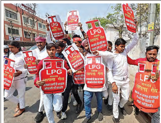
లక్ష్మోని విధాన భవన్ వెలుపల గ్యాస్ కొరతపై గురువారం నిరసన తెలుపుతున్న సమాజ్‌వాదీ పార్టీ నాయకులు, కార్యకర్తలు