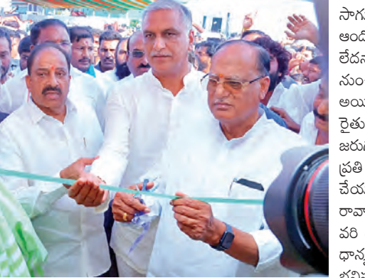
రైతు మేరా మహోత్సవాన్ని స్వీకర్ గద్దం ప్రసాద్ కుమార్ తదితరులతో కలిసి ప్రారంభిస్తున్న మంత్రి తుమ్మల నాగేశ్వరరావు దృశ్యం

అయిల్ ఫ్యాం సాగుకు కేంద్రం ఇచ్చే సబ్సిడీతో రాష్ట్ర ప్రభుత్వం కూడా సబ్సిడీ ఇవ్వడానికి కృషి చేస్తానని స్వీకర్ గద్దం ప్రసాద్ అన్నారు. కేంద్ర ప్రభుత్వం యోధాడికి లక్ష కోట్లు అయిపోయి దిగుమతి చేసుకుంటుందని తెలిపారు. రైతులు అయిల్ ఫ్యాం పంటను సాగు చేయాలని సూచించారు. అయిల్ ఫ్యాం సాగు విషయంలో రైతులు ఆందోళన చెందాల్సిన అవసరం లేదన్నారు. విశాఖలో 2 నుంచి 3 వేల ఎకరాల్లో అయిల్ ఫ్యాం సాగు చేసేలా రైతులను ప్రోత్సహించడం జరుగుతుందన్నారు.